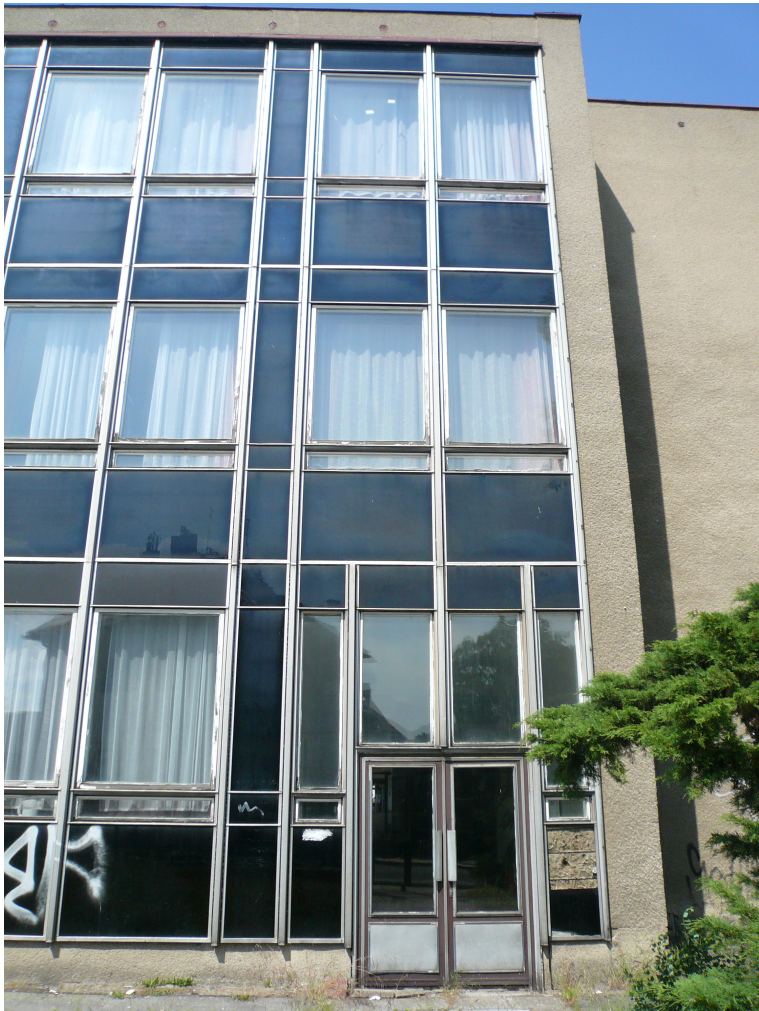
ČÁST JIŽNÍHO PRŮČELÍ